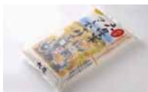
こだわり米「六星米こしひかり」