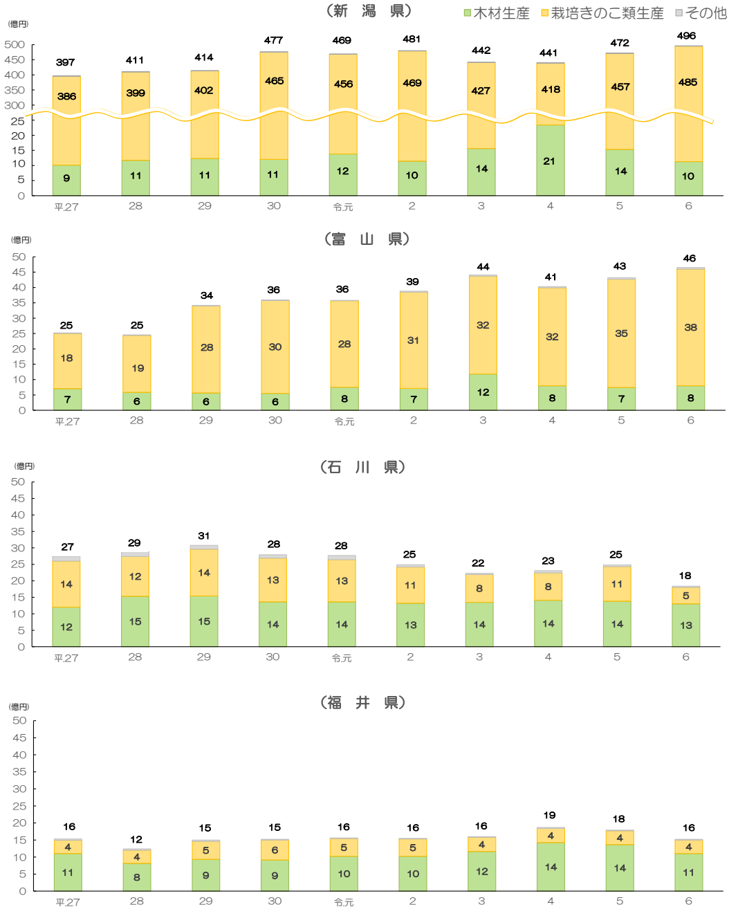
図3 北陸農政局管内各県の林業産出額の推移