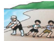
教育と啓発 の場の提供