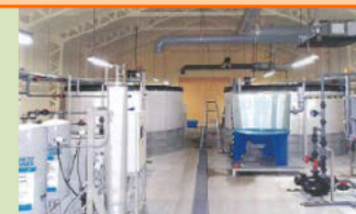
閉鎖循環式陸上養殖の実証試験

・国民に対する安定供給の確保 ・ウナギ資源の持続的利用 ・栽培及び養殖魚種の生産量の回復