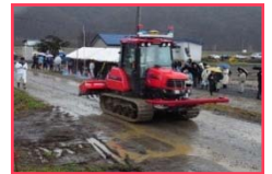
現場での講習・研修会