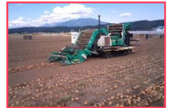
高収益作物の導入(タマネギの収穫)