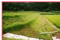
カバープランツ・小段