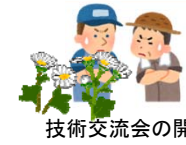
技術交流会の開催