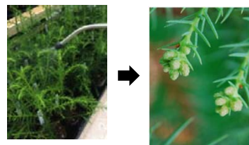
<着花促進剤処理による若齢木の雄花の着花>

○花粉症対策苗木に対する需要の喚起を図るため、花粉発生源の立木の伐倒・除去及び花粉症対策苗木等の植栽を支援