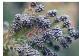
<花粉飛散防止剤により枯死した雄花>