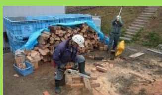
しいたけ原木などとして利用するための伐採活動 (16万円/ha)