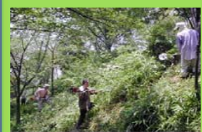
里山林景観を維持するための活動 (16万円/ha)