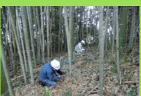
侵入竹の伐採・除去活動 (38万円/ha)