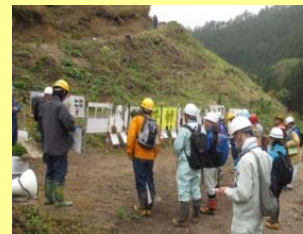
実践的な研修を実施

森林総合監理士等による、森林法等の一部改正等を踏まえた先進的な地域活動の支援、その成果の見える化、全国に普及させるためのネットワーク構築、大学・林業大学校等と連携した技術者の継続教育を実施