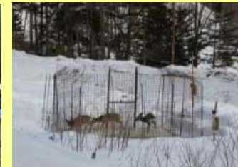
ICTを利用した囲い罠

効果的な鳥獣害対策技術、コンテナ苗の活用による低コスト化など地域の新たな課題に対応した研修の実施