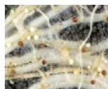
ジャガイモシロシストセンチュウ (根に付着する粒)