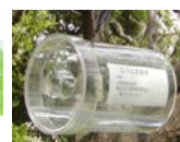
ミバエ侵入警戒トラップ