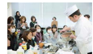
和食文化継承の中核的な人材育成