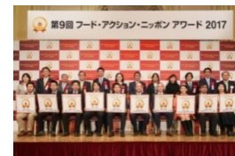
フード・アクション・ニッポン アワードで地域の優れた産品を表彰