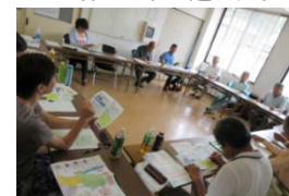
地産地消コーディネーターによる生産現場と学校給食側の調整