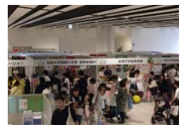
平成30年度食育推進全国大会(大分県大分市)