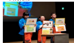
和食文化の子どもたちへの普及のための実践的な研修