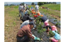
農業体験や収穫物を使った調理体験