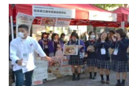
ジャパンハーヴェストによる国産農林水産物の魅力発信