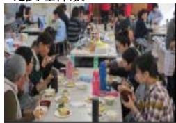
共食の場における食育活動