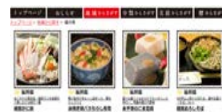
郷土料理の調査・記録・発信