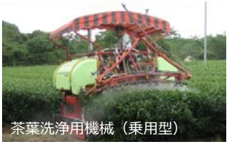
茶葉洗浄用機械（乗用型）

・乗用型洗浄用機械施設により、農作物に付着した火山灰を洗浄し、収量及び商品性の低下を防止します