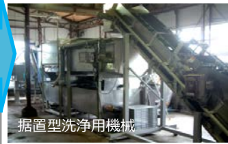
据置型洗浄用機械

・乗用型洗浄用機械施設により、農作物に付着した火山灰を洗浄し、収量及び商品性の低下を防止します