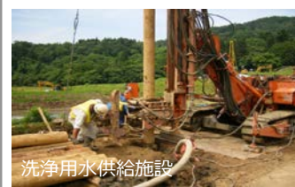
洗浄用水供給施設

・農作物の洗浄のための用水を供給する施設により、洗浄効果を高め、収量及び商品性の低下を防止します