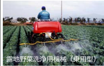
露地野菜洗浄用機械（乗用型）