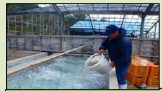
モズクの新規養殖