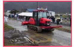
現場での講習・研修会