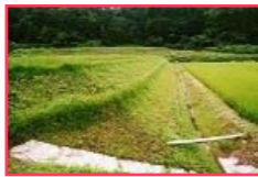
カバープランツ・小段