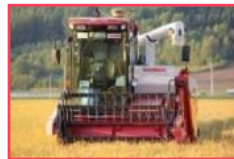
先進的省力化技術導入