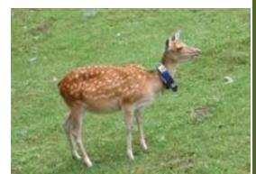
GPS首輪を用いた行動追跡調査

シカの侵入が危惧される地域等において、監視体制の強化を図るため、GPS首輪による行動追跡調査、自動撮影カメラによるシカの出没状況の調査等を実施。