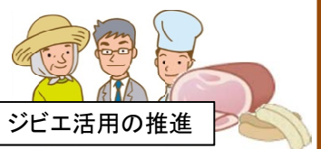
ジビエ活用の推進