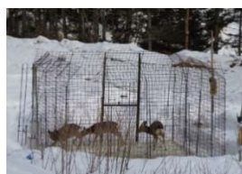
囲いわなによる捕獲

シカ被害の深刻な地域において、市町村や森林管理署等から構成される広域の協議会が計画を策定し、地域の連携により囲いわな等による捕獲や、防護柵設置等の防除活動を実施。