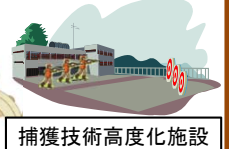
捕獲技術高度化施設