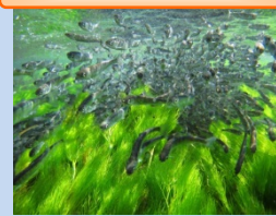
サケ資源の回帰率向上調査