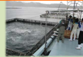
低魚粉配合飼料使用の実証試験