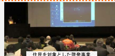
住民を対象とした啓発事業