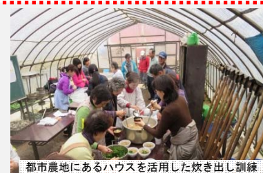
都市農地にあるハウスを活用した炊き出し訓練