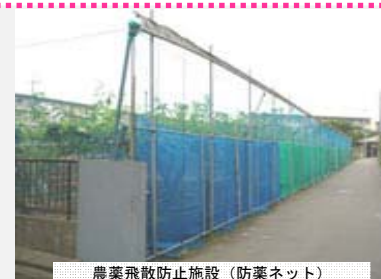
農業飛散防止施設(防葉ネット)