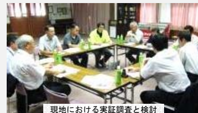
現地における実証調査と検討