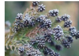
<花粉飛散防止剤により枯死した雄花>