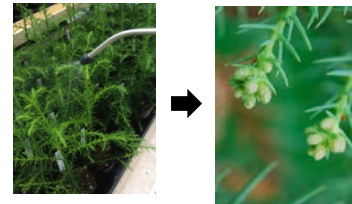
<着花促進剤処理による若齢木の雄花の着花>

○花粉症対策苗木に対する需要の喚起を図るため、花粉発生源の立木の伐倒・除去及び花粉症対策苗木等の植栽を支援