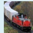
鉄道や船舶による輸送