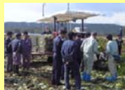
試験ほ場での機械実演