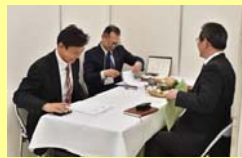
実需者と計画的に協議