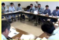
コンソーシアムによる会議