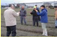
生産者間の生産体制の検討