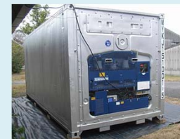
高鮮度保持コンテナ