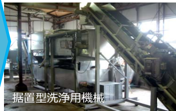
据置型洗浄用機械

・乗用型洗浄用機械施設により、農作物に付着した火山灰を洗浄し、収量及び商品性の低下を防止します。