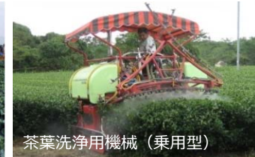
茶葉洗浄用機械 (乗用型)

・乗用型洗浄用機械施設により、農作物に付着した火山灰を洗浄し、収量及び商品性の低下を防止します。