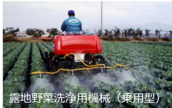
露地野菜洗浄用機械 (乗用型)