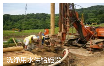
洗浄用水供給施設

・農作物の洗浄のための用水を供給する施設により、洗浄効果を高め、収量及び商品性の低下を防止します。