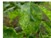
プラムポックスウイルスに感染したウメの葉