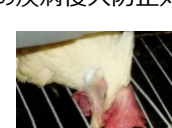
鳥インフルエンザの症状