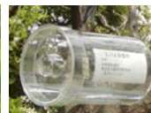
ミバエ侵入警戒トラップ