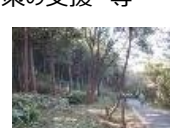
疾病侵入防止対策（草刈り：緩衝地帯整備）