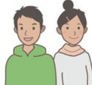
・遠洋漁業における既存の外国人船員