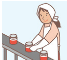
・地域の作業経験者等