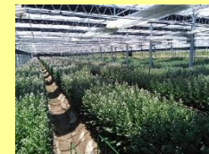
芽かき・摘花等の徹底