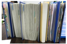
農林水産省所管の補助金申請における添付書類一式の例

農林水産省が所管する全ての行政手続の申請に係る書類や申請項目等の抜本的な見直しを進めながら、農林漁業者等が自分のスマホやタブレット、パソコンから補助金等の申請を行える「農林水産省共通申請サービス」(通称: eMAFF) の機能を拡充し、行政手続のオンライン申請を推進します。