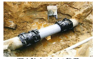
漏水防止のための整備