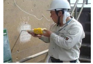
老朽化した施設の機能診断