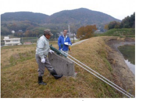
ため池の現地パトロール

【お問い合わせ先】 農村振興局水資源課 (03-3502-6246) 防災課 (03-6744-2210) 設計課 (03-6744-2201) 地域整備課 (03-6744-2209)