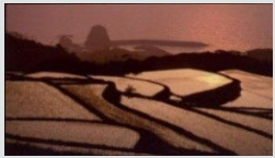
中山間地域 (山口県長門市)