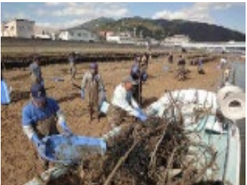
災害時の流木の回収・処理