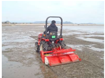
干潟等の保全（干潟の耕うん）