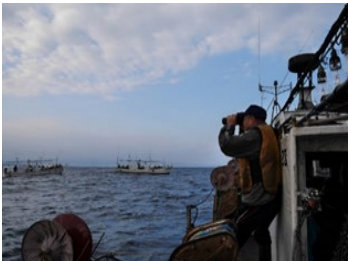
国境・水域の監視