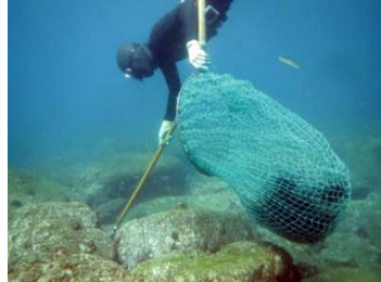
藻場の保全（ウコの駆除）