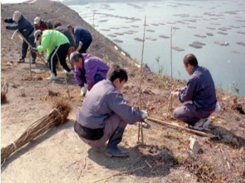
藻場・干潟等の保全（流域における植林）