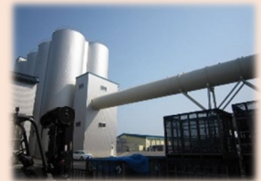
乾燥調製施設の整備 (1/2以内)