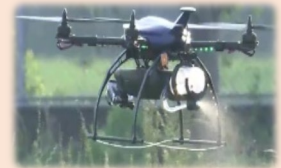
農業機械の導入 (1/2以内)