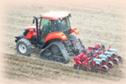
営農技術の導入 (定額)