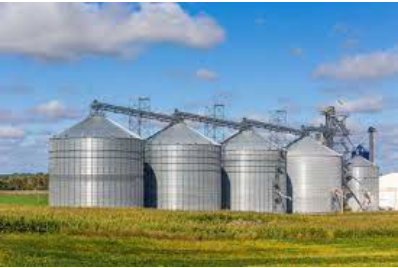
【海外の穀物大型貯蔵施設】

サプライチェーンの効率化・安定化に向けた 出荷・輸出入管理システムの構築に向けた調査