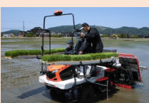
GPSアシスト機能付き田植え機