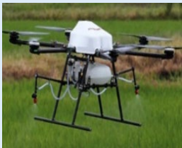
農薬散布用ドローン