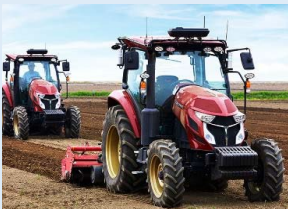
自動操舵トラクター