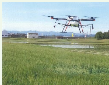
〔例〕スマート農業機器の活用