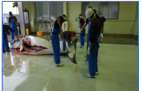
処理施設の集約化