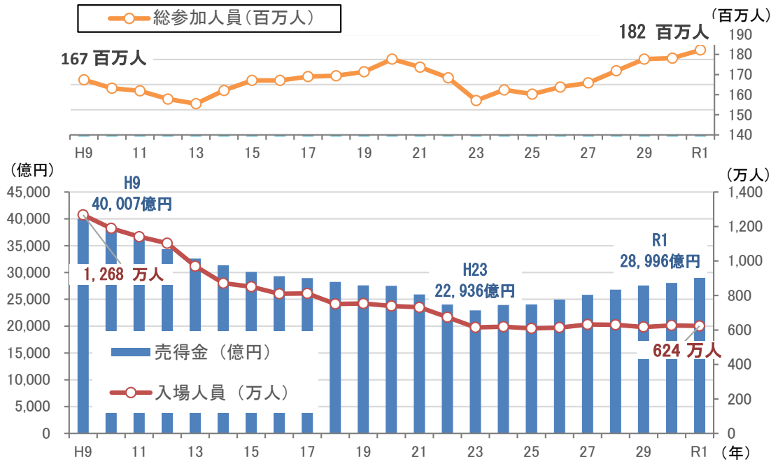
形態別売得金（令和元年）