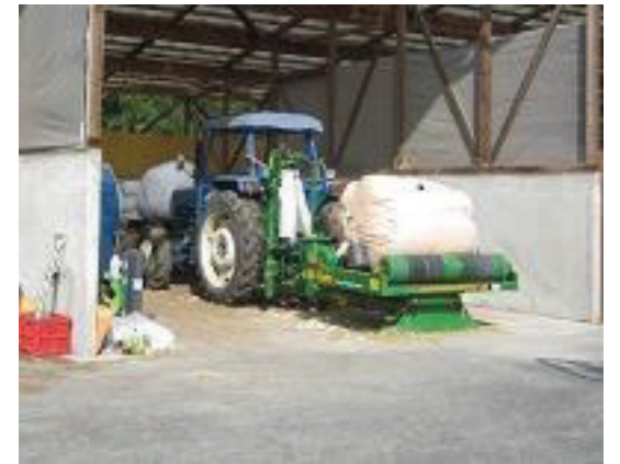
フレコンラップ法による 粳米サイレージ調製