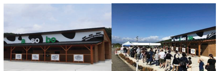
食肉加工施設「a so bo」とイベント時の賑わい