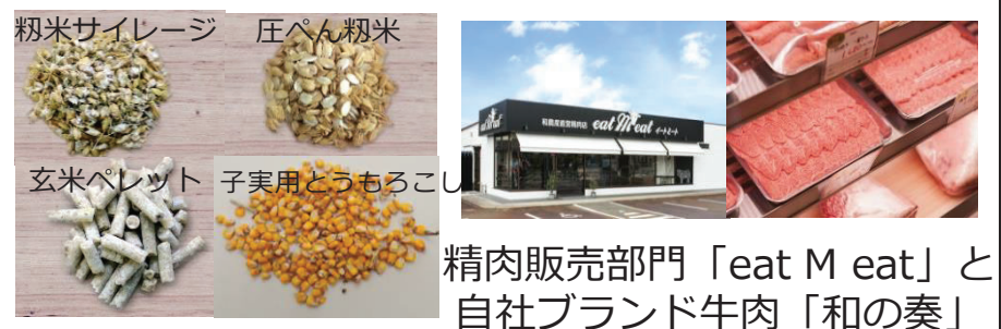
精肉販売部門「eat M eat」と 自社ブランド牛肉「和の奏」