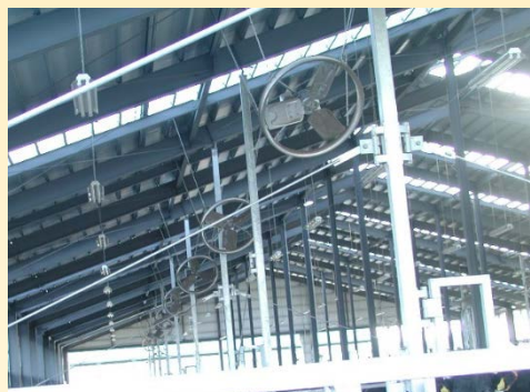
天井からの採光や 換気扇の設置