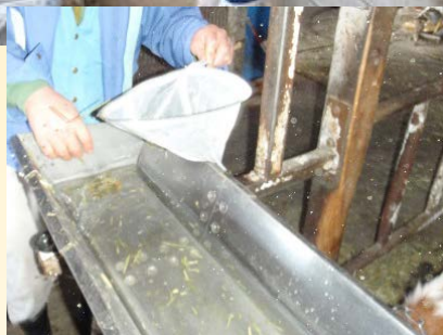
健康状態を保つため、飼槽や 水槽のチェックと清掃