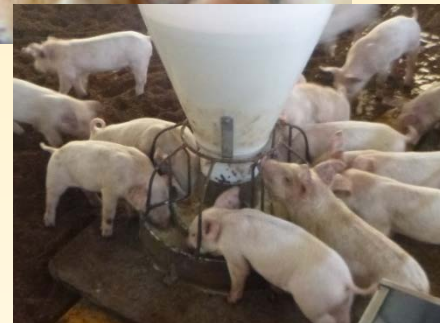
群内の争いを極力減らすため、 一度に多くの個体が食べたり 飲んだりできる給餌器や飲水 器の使用