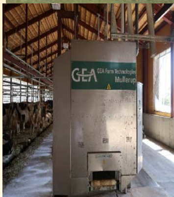
草食動物への良質な牧草の給与 自動給餌機による適切な飼料給与