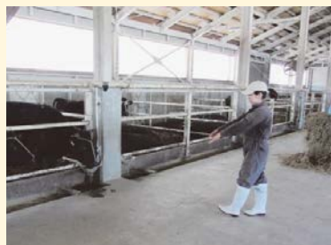
牛が逃走を開始する 距離を事前把握