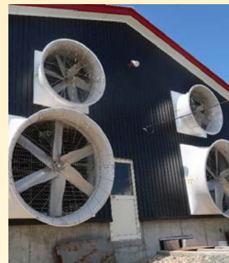
自動換気装置による 温度などの管理