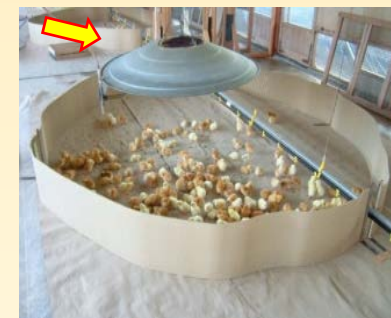
ガスストーブによる ひよこの保温