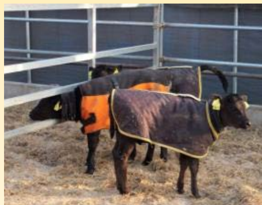
保温性に優れたジャケットを 着た子牛