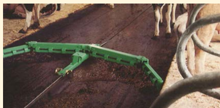
バースクレーパーによる適時の除糞