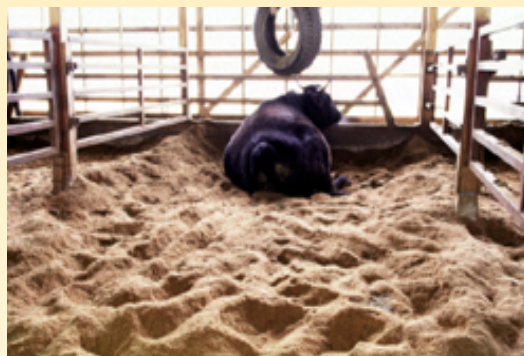
おがくずを床に敷いて、 清潔さが保たれている畜舎