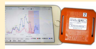
センサーによる 行動観察