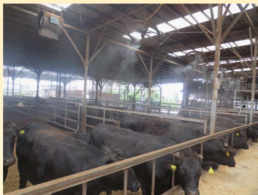
ミストの噴霧と換気扇による 畜舎の冷却