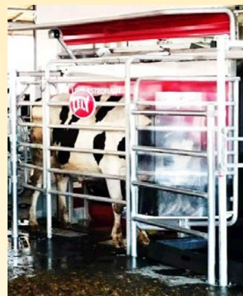
搾乳ロボットにより乳が 張れば、牛が自ら行動 し、乳房炎を予防