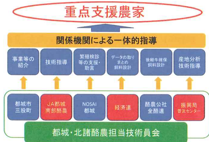
図2 地域の支援体制図