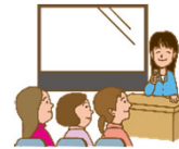
普及セミナーの開催