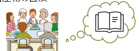
手引き書等の作成