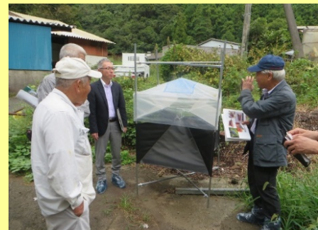
専門家による指導状況