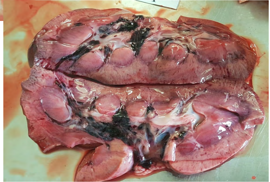
腎臓(皮質及び腎盂)の出血