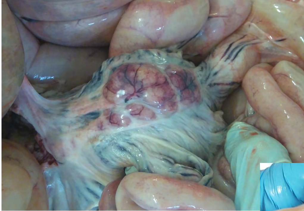
腸間膜リンパ節の腫大・出血