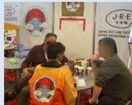
▲ブースでの商談の様子

コメについては、アメリカ向けのほか、カナダやメキシコ向けにも引き合いがあり、また米菓は、現地系バイヤーに焦点を絞った商品開発やPB商品化の提案等が好評を得た。