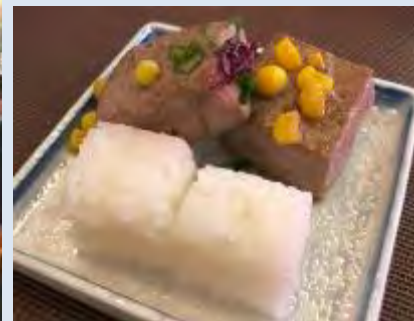
▲日本産水産物コラボの試食メニュー (小俵おにぎりとマグロガーリックバター)