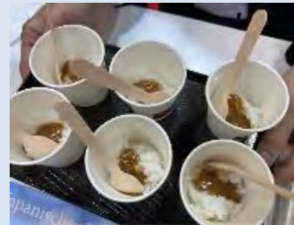
▲日本産米を使用した日本式カレーの提供