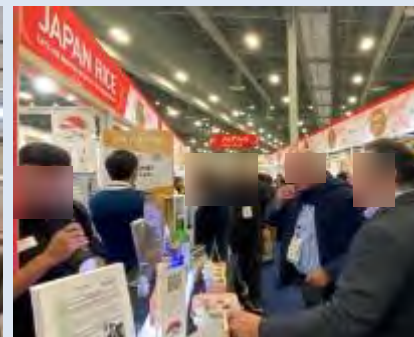
▲展示会会場の様子