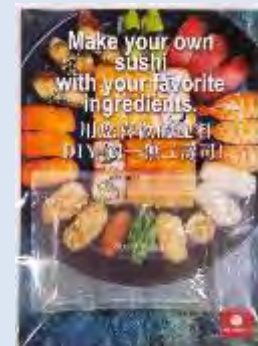
▲パックご飯に添付したすし酢

パックご飯に対する認知度は高いものの、購入経験率は低く、パックご飯を使った日本食メニューの提案をすることで、購買意欲が増加するという結果となった。現地系消費者へのパックご飯の需要拡大に向けて、この結果を今後のプロモーション等に反映できるよう、会員企業にフィードバックを実施。