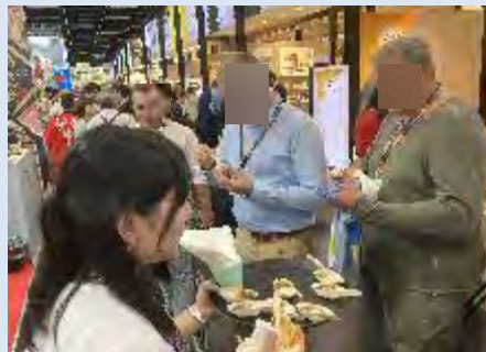
▲展示会会場の様子

見本市終了後も、全米輸独自で商談会を開催し、試飲・試食のほか、日本産米・米関連食品の魅力についてのセミナーを実施。