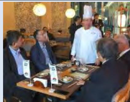
▲プロモーションイベントの様子

プロモーションイベントの試食会では、JETROリヤド事務所と連携して、日本産水産物を活用した日本産米の試食メニューも提供。事業実施後も更なる成約獲得に向けて、フォローアップを実施。