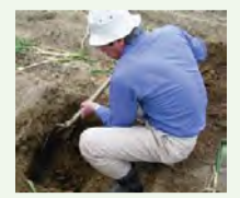
土壌診断に基づく施肥