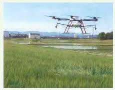
【例】スマート農業機器の活用