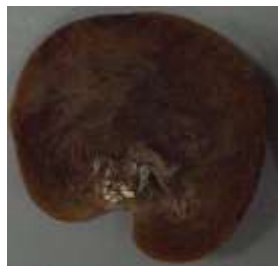
2 扇形 fan shaped