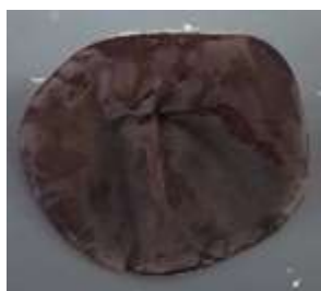
1 漏斗形 funnel shaped