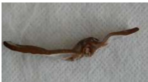
1 平面形 planar