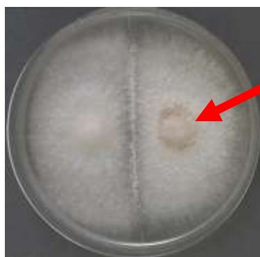
1 無 absent 2 有 present

光源・光量は、青色光(ピーク波長460nm前後)の場合1~3mol・m -2 ・s -1 程度、蛍光灯の場合80~100lux程度とする。