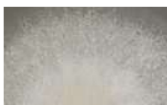
2 中 medium