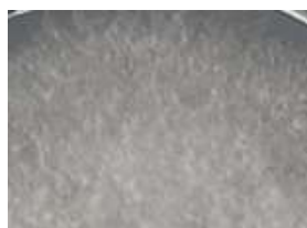
1 粗 sparse

常法(121℃、15分)により滅菌し、シャーレ (内径9cm、高さ2cm) に20ml分注して作製した平面培地の中央部付近に、別に供試培地で前培養(25±1℃、10~15日間)した2核菌糸体の小片(直径5mm程度)をコルクボーラーで打ち抜いて接種する。30±1℃で20日程度暗培養し、菌糸がシャーレ上に70%程度に成長した時期に調査する。最低供試数はシャーレ3枚以上とする。