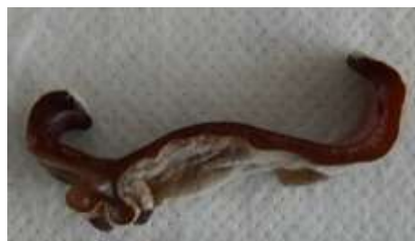
2 褶曲形 fold