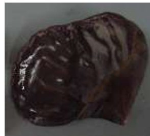
3 盤形 saucer