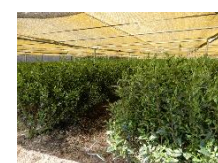
抹茶原料等の生産に向けた栽培転換