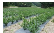
茶の改植や有機転換等