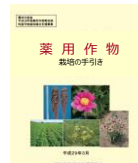
栽培マニュアルの作成