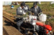
機械・技術の改良