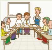
生産者の合意形成のための打合せ