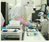
食品加工施設の整備