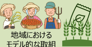
地域におけるモデル的な取組