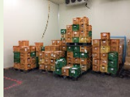
区分管理のための小規模貯蔵施設の整備

（ハード支援） 交付率：1/2 交付金額の上限：2億円 ※総事業費が1億円以上の事業が対象 （ソフト支援） 交付率：定額 交付金額の上限：650万円