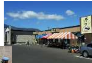
直売所「野市里(のいちご)」 兼レストラン「こぞくら」