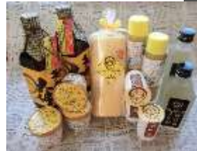
嶽きみ加工品(焼酎、ロールケーキ、ドレッシング等)