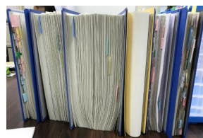
農林水産省所管の補助金申請における添付書類一式の例

農林水産省が所管する全ての行政手続の申請に係る書類や申請項目等の抜本的な見直しを進めながら、農林漁業者等が自分のスマホやタブレット、パソコンから補助金等の申請を行える「農林水産省共通申請サービス」（通称：eMAFF）の機能を拡充し、行政手続のオンライン申請を推進します。