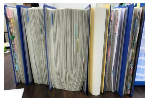
農林水産省所管の補助金申請における添付書類一式の例

農林水産省が所管する全ての行政手続の申請に係る書類や申請項目等の抜本的な見直しを進めながら、農林漁業者等が自分のスマホやタブレット、パソコンから補助金等の申請を行える「農林水産省共通申請サービス」（通称：eMAFF）による行政手続のオンライン申請を推進します。