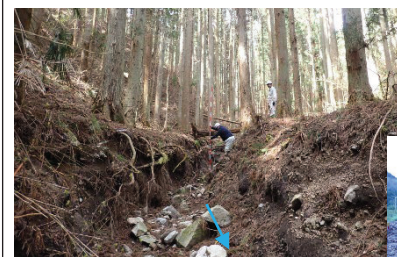
令和5年台風第13号により山腹が拡大崩壊し下流保全対象が被災