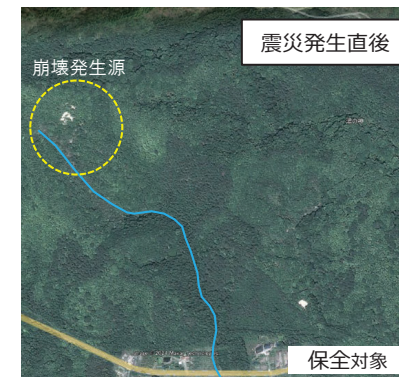
東日本大震災の発生により山腹崩壊が新たに発生