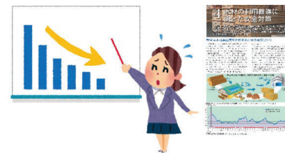
風評被害防止対策の実施