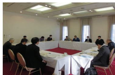
安全証明体制に向けた有識者検討会