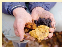
土壌再生の機序を解明し、土壌創製技術を確立