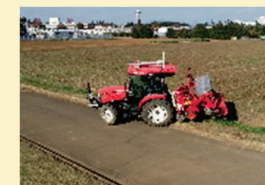
自律的に移動・作業する自動走行システムの構築

[お問い合わせ先] 農林水産技術会議事務局研究企画課 (03-3501-4609)