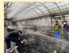
有機物の効用を科学的に解明